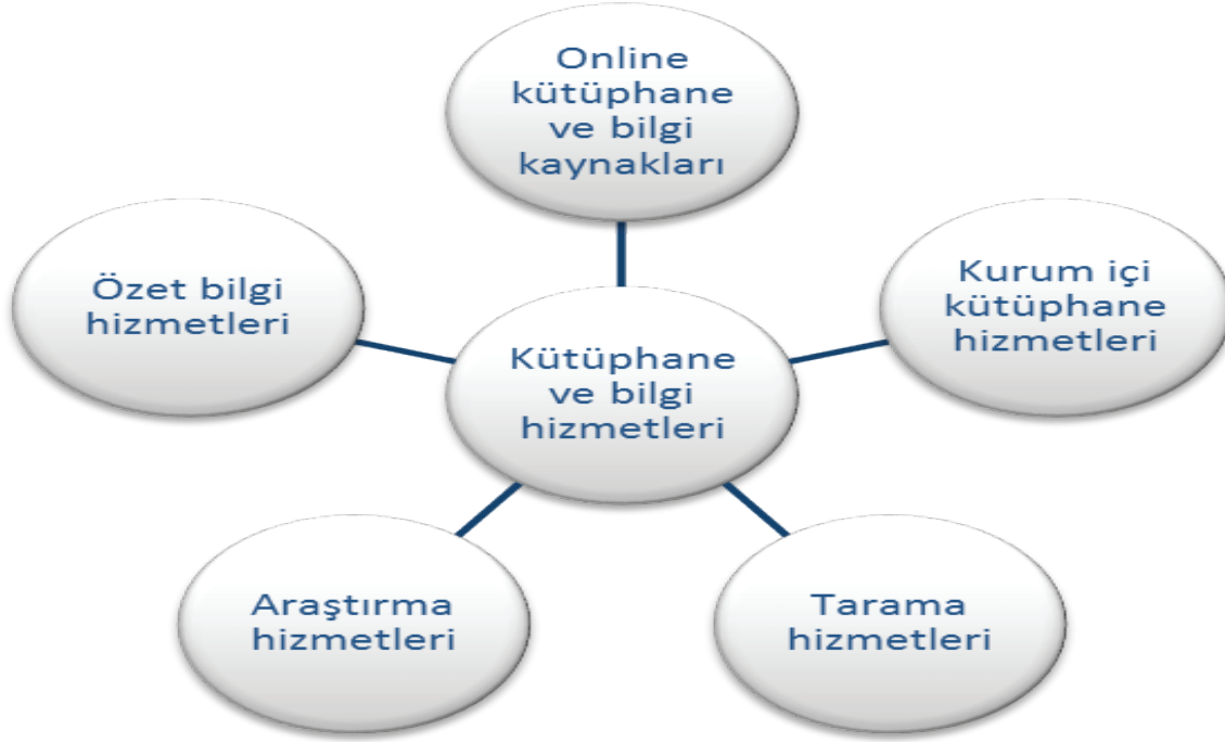
(Şekil 1): Meslek dernekleri için bilgi hizmetleri modeli (Madden, 2008, s. 563)

Günümüzde kütüphanecilik alanında faaliyet gösteren derneklerin aşağıda konularda hizmet geliştirmeleri gerektiği üzerinde durulmaktadır.