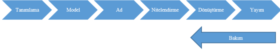
Şekil 2. Tipik Bir Bağlı Veri Üretim Süreci (Hyland ve Wood, 2011, s.11)

Öte yandan 2011’de W3C Kamusal Bağlı Veri Çalışma Grubu (The W3C Government Linked Data Working Group), ülkelerin ellerindeki bilgiyi W3 tarafından geliştirilen bağlı veri yapılarını kullanarak yayımlayabilmelerini desteklemek amacıyla kurulmuştur (World Wide Web Consortium, 2011). Çalışma grubu web tabanlı ortak tanımlama kriterleri geliştirme faaliyetlerini sürdürmektedir. Bu kapsamda elektronik ortamda bilgi içerikli kültür mirası niteliğindeki içeriğin web tabanlı sistemlerde tanımlanmasında yukarıda yer alan adımların takip edilmesi ve ortak standartlara uyumlu platformlar geliştirilmesi önemli görülmektedir.